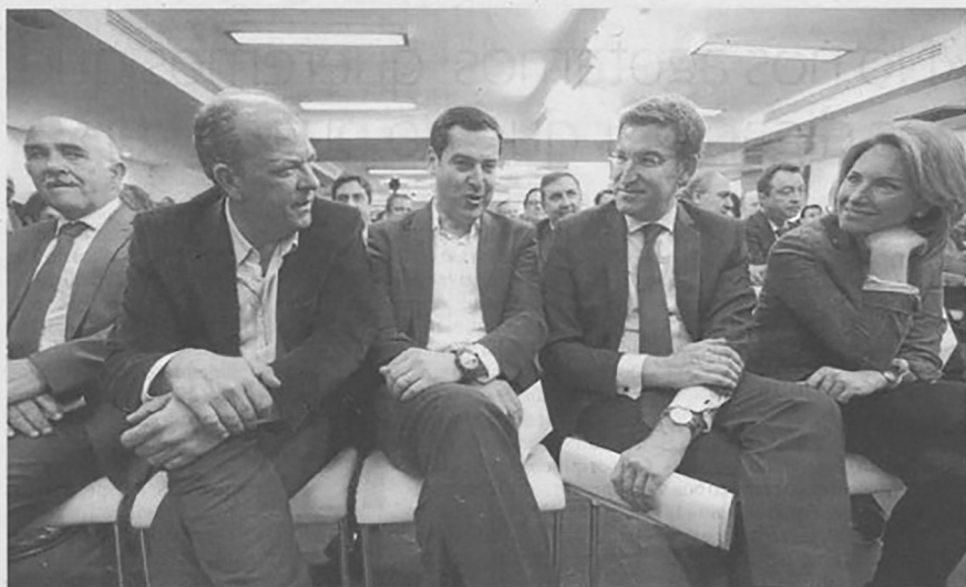
Alberto Garre -izquierda-, junto a José Antonio Monago, Juan Manuel Moreno, Alberto Núñez Feijóo y Arantza Quiroga, en la Junta Directiva Nacional del PP celebrada ayer en Madrid.