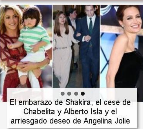
El embarazo de Shakira, el cese de Chabelita y Alberto Isla y el arriesgado deseo de Angelina Jolie