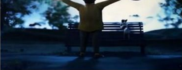
Hace 45 años, el hombre llegó a la Luna. ¿Sabías que tenía propietario?