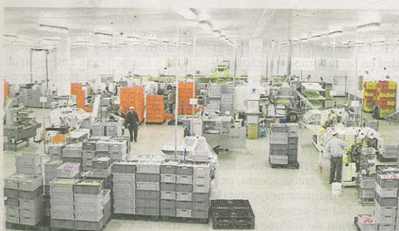
Amplias instalaciones de Caramelos Cerdán. C.C.