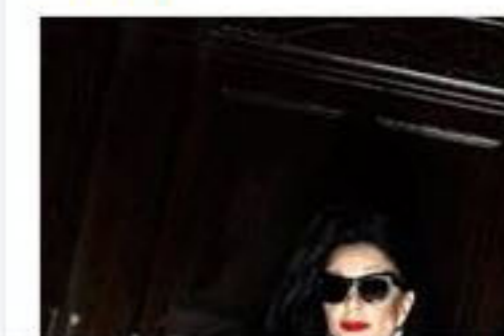
Gente Digital en Facebook

Canciones para robots... pero sobre todo para personas. Fangoria se somete a nuestro cuestionario. ¡No te lo pierdas!!