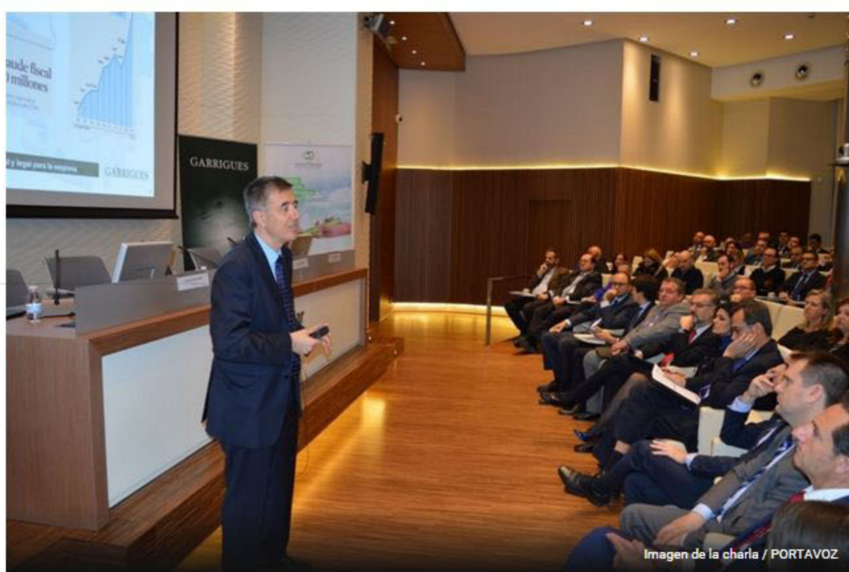
Imagen de la charla / PORTAVOZ