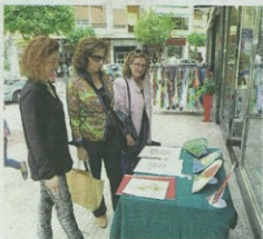
Algunas mujeres realiza compras en el Mercadillo de Las Pulgas.