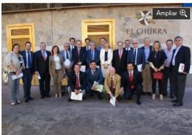
Foto de los integrantes del 'Foro Experiencia', organizado por Amefmur en un restaurante de la capital. L.O.

L.O. La Asociación Murciana de la Empresa Familiar (Amefmur) organizó ayer una reunión para abordar asuntos como gobierno, profesionalización de la gestión y responsabilidad social corporativa, denominada 'Foro de la Experiencia'. Se trata de una acción que buscaba «crear un espacio de intercambio de ideas y experiencias sobre el presente y el futuro de este colectivo», según indicaron en un comunicado.