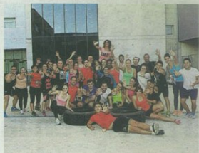
Participantes en las actividades de JCI.

de ideas y experiencias sobre el presente y el futuro de este colectivo. Con la participación de empresarios familiares de diferentes generaciones, este foro ha tratado de recoger la riqueza y complejidad de la empresa familiar analizando buenas prácticas en aspec-