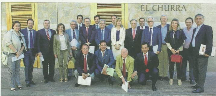
Foto de los integrantes del 'Foro Experiencia', organizado por Amefmur en un restaurante de la capital.