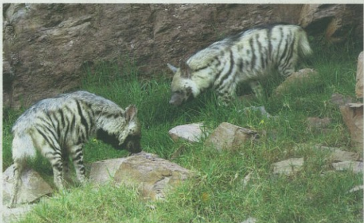
Las hienas rayadas Punto y Raya, en su ubicación en el parque Terra Natura de Murcia.

Gobierno, profesionalización de la gestión y responsabilidad social corporativa. Estos han sido los temas sobre los que ha girado la reunión del Foro de la Experiencia, un espacio de debate que impulsa la Asociación Murciana de la Empresa Familiar (Amefur) para crear un espacio de intercambio